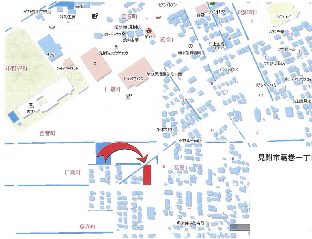
見附市葛巻一丁目地内