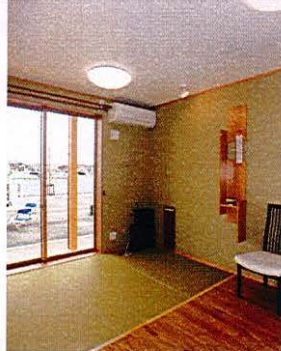
ダイニング+畳スペース