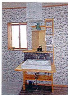
造付けシャンプース洗面化粧台