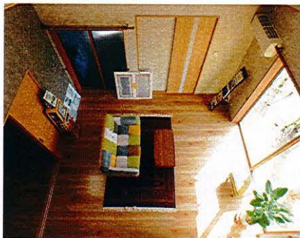
吹抜からリビングが見えます